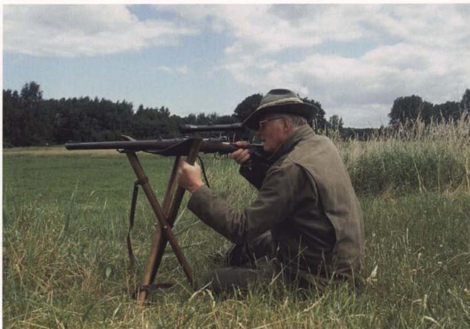
Myśliwy na ziemi, broń na stołku myśliwskim – wspaniała, stabilna podpórka.

Jeśli niespodziewanie na krótkim dystansie pojawi się lis, również nie musisz przeładowywać. Posłużysz się szybko tylnym spustem.