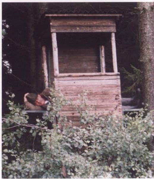
...tworząc powierzchnię do spania.