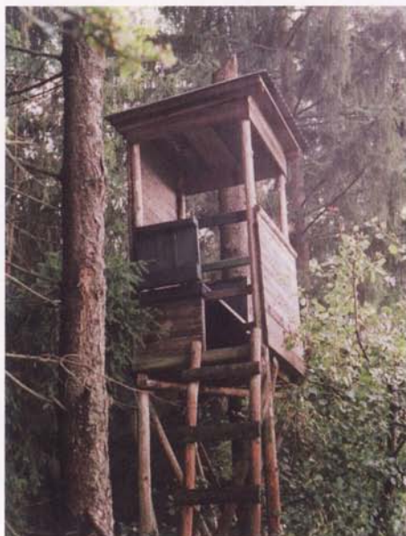
Boczne ściany zostają opuszczone...

Podsyp winien zapewniać kurakom nie tylko karmę, ale i bezpieczne schronienie. By jastrząb nie mógł tu dziesiątkować przybywającego na posiłki stada, na dach podsypu kładzie się przeszkadzające temu gałęzie w taki sposób, by ich końce sięgały ziemi. Tworzą one tarczę ochronną, za którą kuraki mogą się bezpiecznie ukryć. Jednocześnie musimy mieć możliwość łatwego usunięcia takiej tarczy, gdy chcemy uzupełnić zapasy karmy. W tym celu gałęzie maskujące winny tworzyć związany u góry pęk, możliwy do podniesienia jednym ruchem.