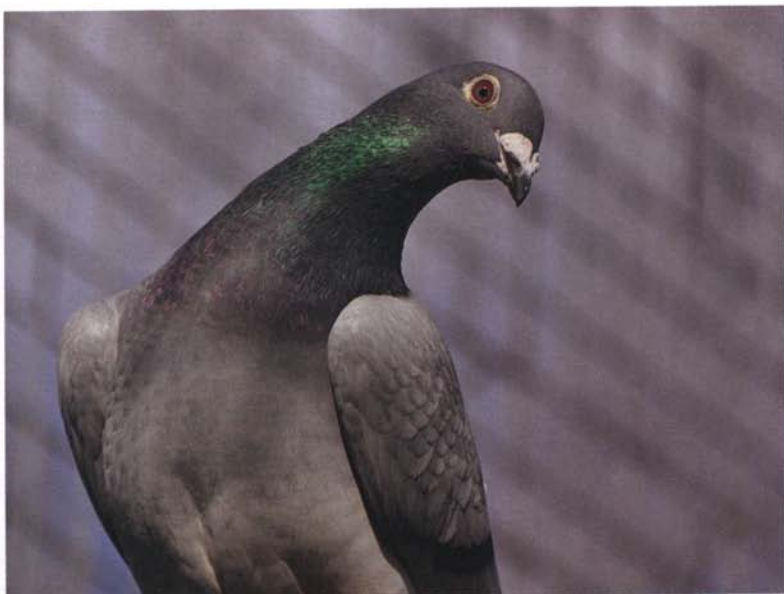
Uważne spojrzenie młodego gołębia.