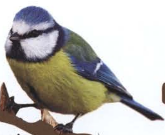
MODRASZKA str. 45