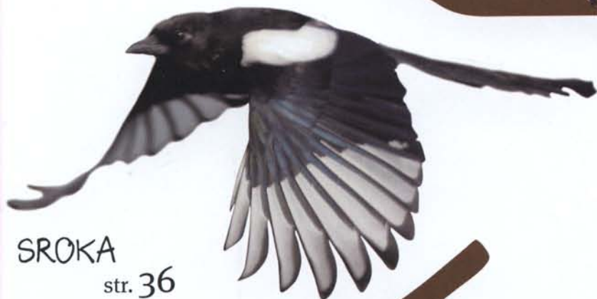
SROKA str. 36