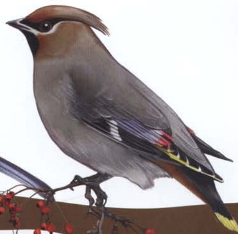
JEMIOŁUSZKA str. 56