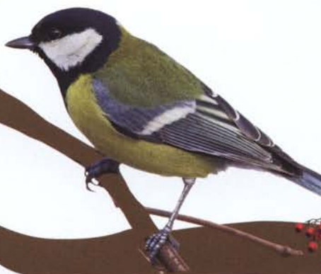
BOGATKA str. 42