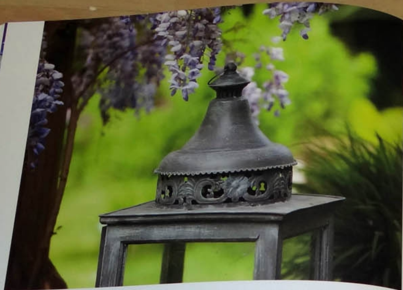
U góry i po prawej Dekoracje decydują o charakterze przestrzeni.