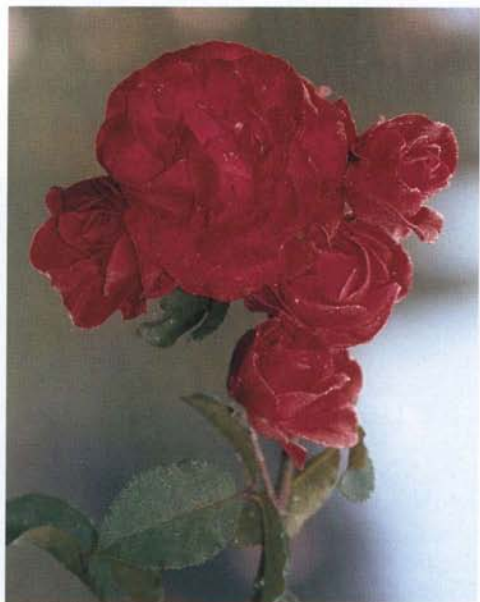
'Gruss an Heidelberg'

'Händel' . Climber. Hodowca: Mc Gredy, 1965. Kwiaty duże, pełne, białe z różowym obrzeżem, szlachetnego kształtu, w kwiatostanach najczęściej po kilka. Kwitnie od czerwca do jesieni. Liście duże. Pędy sztywne, grube, pokrój wzniesiony. Wzrost umiarkowanie silny, krzewi się dobrze. Wysokość 3 m. Najlepiej rośnie w pełnym słońcu. Może być różą parkową.